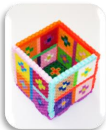
ペン立て・小物入れ各種 サイズにより ¥300～¥800